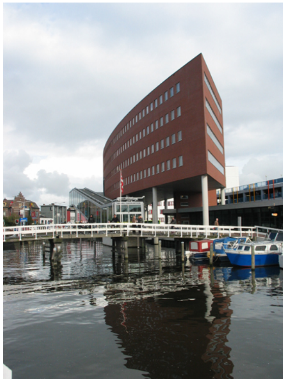
Het stadskantoor van Alkmaar, het oude stadhuis in de binnenstad is nog steeds in gebruik, maar de meeste publieksfuncties zijn naar het nieuw gebouwde stadskantoor langs het Noord-Hollands Kanaal verplaatst.

De gemeente ligt in de samenwerkingsregio Kennemerland, en deels in West-Friesland. Het verstedelijkte gebied om Alkmaar neemt in de regio een belangrijke plaats in. Het is min of meer vastgegroeid aan plaatsen als Heerhugowaard, Noord-Scharwoude, Zuid-Scharwoude, Broek op Langedijk, Sint Pancras, Oudkarspel, Obdam, Hensbroek, Bergen, Heiloo, Limmen, Castricum en Uitgeest. De complete agglomeratie, ook wel Groot-Alkmaar genoemd, strekt zich globaal uit van Uitgeest tot en met de dorpen in het zuiden van de gemeente Schagen en van Bergen tot en met Obdam. Deze agglomeratie telt ongeveer 305.000 inwoners.