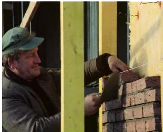
Reportage uit 1976 over de eerste 25 gezinnen die vanuit Amsterdam naar de nieuwe stad Almere verhuisden

De Rijksdienst voor de IJsselmeerpolders (RIJP) gebruikte aanvankelijk de werknaam 'Zuidweststad' voor de nieuwe stad. In 1970 werd gekozen voor de naam Almere, waarbij alternatieve namen ('IJmeerstad', 'IJrecht', 'Nieuw Amsterdam', 'Eemmeerstad' en 'Flevostad') afvielen. De nieuwe naam werd in 1971 voor het eerst gebruikt. [3]