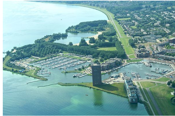
Luchtfoto van Almere Haven met Golvend Land

Bekende of opmerkelijke bouwwerken in Almere: