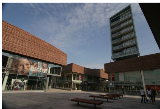
Winkelstraat in het stadscentrum

Het stadshart van Almere Stad heeft het grootste winkelgebied van Almere en is een van de grootste winkelcentra van Nederland. Ook Almere Haven en Almere Buiten hebben forse winkelgebieden. Sinds 2006 mogen winkels in heel Almere op zondagen geopend zijn. Hoewel niet alle winkels hiervan gebruikmaken, zijn veel supermarkten,