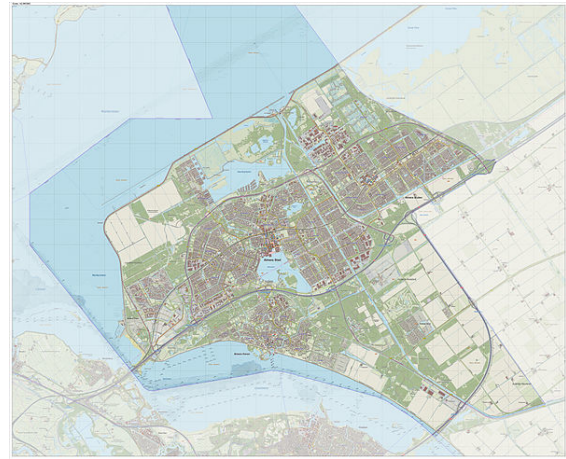
Topografische gemeentekaart van Almere, sept. 2014

Almere is thans de grootste gemeente van Flevoland met 197.318 inwoners (31 maart 2015, bron: CBS), alhoewel Lelystad qua oppervlakte groter is. Qua inwonertal is Al-