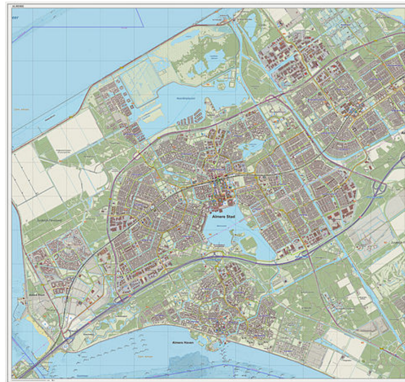
Infrastructuur van Almere, met wegen uit de Open Street Map, maart 2014