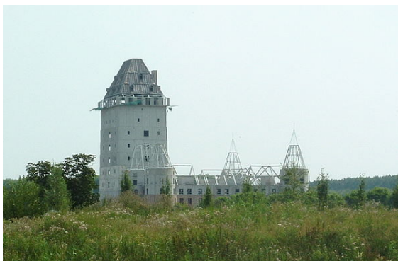
Het onvoltooide Kasteel Almere

Almere staat bekend om de bijzondere bouwwerken en architectuur in de stad. Met name in het stadscentrum is er moderne architectuur te vinden. De gemeente investeert tevens in enkele cultuurexperimenten zoals De Fantasie , De Realiteit en De Eenvoud . In deze wijken hebben de bewoners zelf hun huis ontworpen.