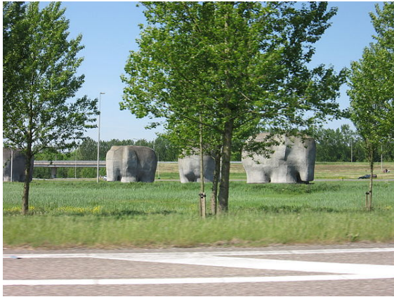
Olifanten van Almere bij knooppunt Almere