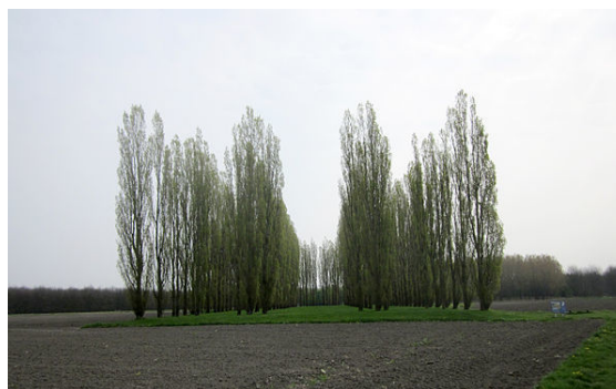
De Groene Kathedraal door Marinus Boezem

Almere heeft diverse natuur- en recreatiegebieden: