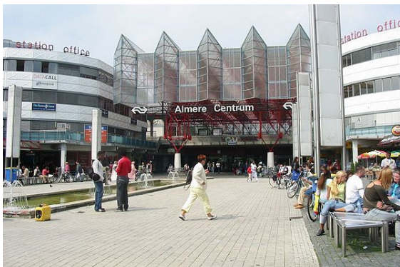
Station Almere Centrum

In 1987 is Almere aangesloten op het landelijke spoorwegnet via de in 1988 voltooide spoorlijn Weesp - Lelystad (de Flevolijn ), die sinds 2012 doorloopt tot Zwolle (de Hanzelijn ). Almere heeft zes stations: Almere Poort, Almere Muziekwijk, Almere Centrum, Almere Parkwijk, Almere Buiten en Almere Oostvaarders. Het voormalige station Almere Strand werd in 2012 afgebroken.