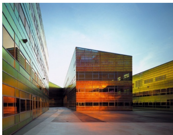
Kantorenblok La Defense door Ben van Berkel

Almere is oorspronkelijk gebouwd als overloopstad voor zowel Amsterdam als Het Gooi. Nog steeds wonen er veel mensen die geboren zijn in Amsterdam en in Het Gooi. Veel van de inwoners hebben een relatie met deze regio's (werk, recreatie, sociale contacten, etc.). Het gevolg is dat er een grote verkeersstroom (auto, trein) is tussen Amsterdam en Het Gooi. Zowel de autoweg als de spoorweg via de Hollandse Brug bij Muiderberg en Stichtse Brug bij