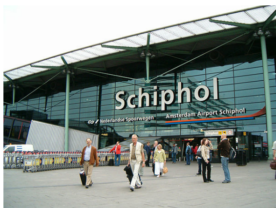
Voorgevel van Schiphol Plaza

Ten zuidwesten van Amsterdam, in de gemeente Haarlemmermeer, ligt de internationale luchthaven Schiphol. Deze luchthaven is erg belangrijk voor de werkgelegenheid onder de Amsterdammers. Er werken 57.000 mensen. Ook zijn er door Schiphol rond de 50.000 indirecte arbeidsplaatsen. De stad heeft aan de luchthaven een deel van haar economische positie op Europees niveau te danken. Bedrijven met een vestiging in de hoofdstad noemen de luchthaven dikwijls als een van de grote kwaliteiten van de stad, en een motief om zich aldaar te vestigen.