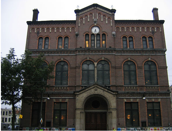
Paradiso, gelegen aan de Weteringschans.

bekende cabaretheaters in de stad zijn De Kleine Komedie, Boom Chicagoo en Toomler.