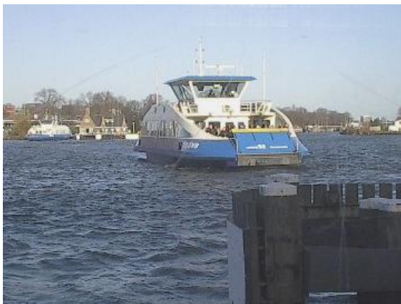
Veerpont van GVB gezien vanaf de De Ruijterkade.

stad wordt aangelegd. De ontwikkelingen in ondergrondse metrobouw hebben decennia lang stilgelegd naar aanleiding van het hevig volksverzet bij de bouw van de huidige Oostlijn. De Noord/Zuidlijn zal na voltooiing in 2017 naar verwachting 200.000 mensen per dag vervoeren en is daarmee dan met afstand de drukste lijn van de stad. Het tracé loopt van Buikslotermeer via Centraal Station naar Station Zuid.