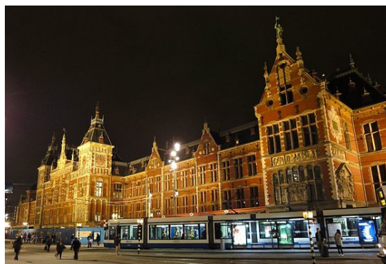
Het Centraal Station van Amsterdam is een van de drukste treinstations van Nederland. [37]

Amsterdam heeft tien NS-stations. De stations Amsterdam Centraal, Sloterdijk, Zuid, Amstel en Bijlmer ArenA hebben een Intercity-status. De andere stations in de stad zijn Holendrecht, Lelylaan, Muiderpoort, RAI, ArenA (alleen bij evenementen) en Science Park. Naast deze tien stations worden ook de stations Duivendrecht, Diemen en Diemen Zuid door reizigers van en naar Amsterdam gebruikt, maar deze stations liggen niet in de gemeente Amsterdam.