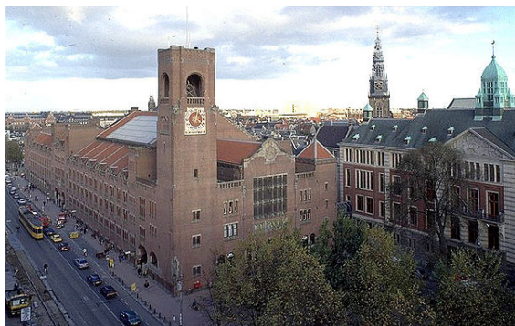
De Beurs van Berlage met Damrak en Beursplein met rechts de Effectenbeurs (Euronext)

Het algemene beeld dat van Amsterdam geldt is dat van een handelsstad. Al in de Gouden Eeuw ging dat niet zonder industrie (scheepsbouw, bierbrouwerij, touwslagerij, houtzagerij), zakelijke diensten (beurs, verzekeringen, bankwezen), communicatie (uitgeverijen, drukkerijen), wetenschap (Atheneum Illustre, kennisinstituten) en gelegenheden (kroegen, theaters en restaurants).