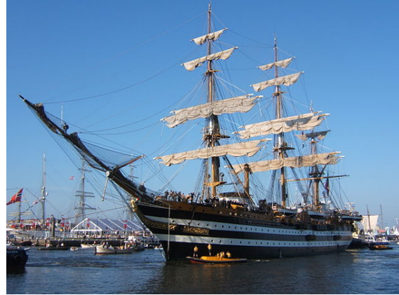
Amerigo Vespucci tijdens Sail Amsterdam.

Amsterdam organiseerde in 2007 meer dan 140 evenementen. [35] Enkele bekende lokale evenementen zijn het Holland Festival voor de kunsten in juni, de Gay Pride, een homo-evenement in augustus waar de bekende grachtenparade onderdeel van is, en later in augustus het Grachtenfestival Amsterdam (waarvan het Prinsengrachtconcert een van de meer dan 250 concerten is) en de driedaagse Uitmarkt. Eveneens in augustus vindt iedere vijf jaar Sail Amsterdam plaats (eerstvolgende in 2020). Over het IJ Festival is een jaarlijks terugkomend evenement, startend op de eerste donderdag in juli. In november wordt Sinterklaas verwelkomd.