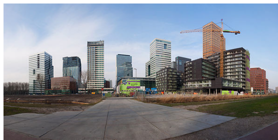
De Zuidas, het nieuwe Amsterdamse zakendistrict

Vreedzaam was de grote vredesdemonstratie tegen kruisraketten op 21 november 1981 met 400.000 deelnemers.