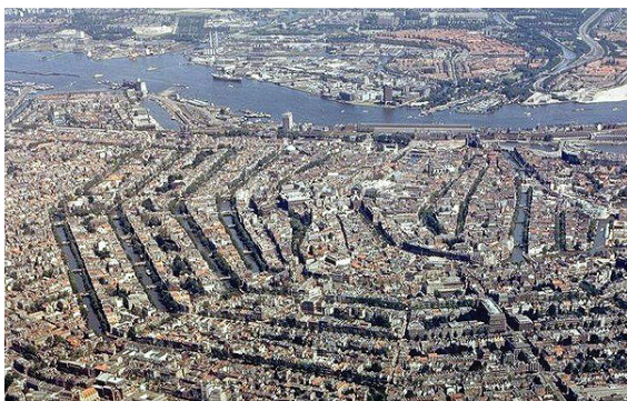
Luchtfoto van de Amsterdamse grachtengordel.

de in de 19e eeuw gebouwde toenmalige arbeidersbuurten Spaarndammerbuurt, Staatsliedenbuurt, Kinkerbuurt, Pijp en Oost. Bekende plaatsen in de stad zijn De Dam, het Museumplein, het Vondelpark, het Waterlooplein en dierentuin Artis.