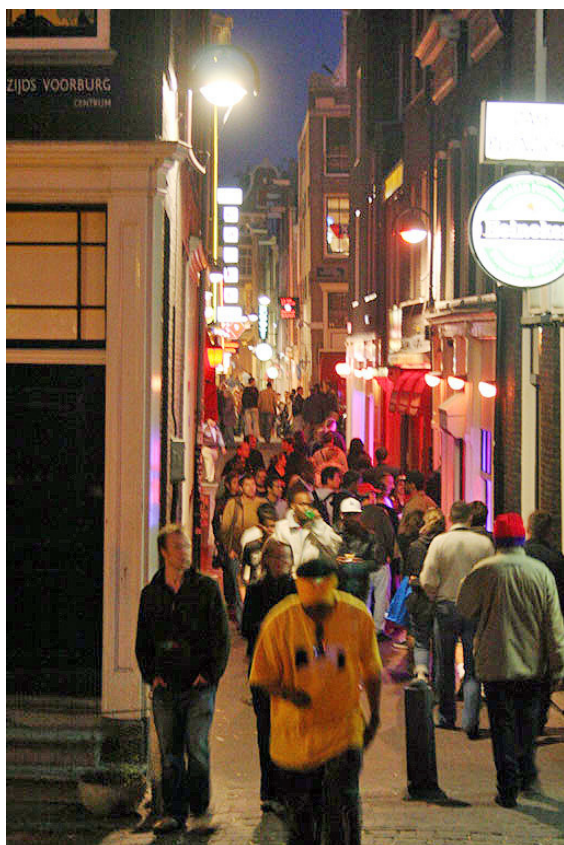
De Wallen, de rosse buurt van Amsterdam.

Het toerisme in Amsterdam is belangrijk voor de stad; elk jaar wordt het door zo'n 4,5 miljoen mensen van over de hele wereld bezocht. Hiermee is het de op vier na vaakst bezochte stad van Europa. Ook komen er jaarlijks een kleine 16 miljoen dagjesmensen naar Amsterdam. De stad is weer terug van weggeweest waar het gaat om de populariteit onder Nederlandse jongeren. Onder hen zijn vooral de vele winkels, de horeca en de culturele instellingen en evenementen een reden voor een bezoek.