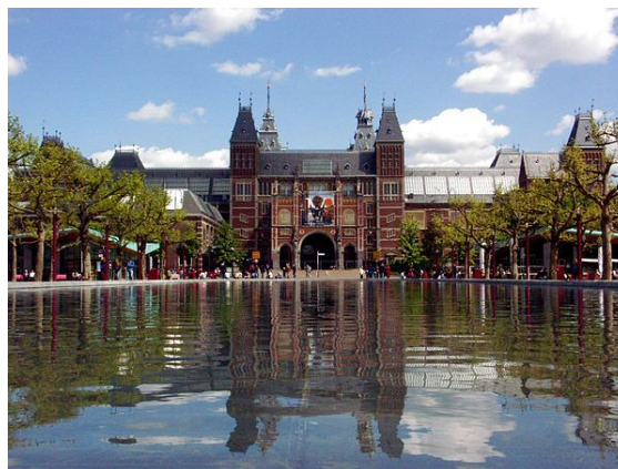
Het Rijksmuseum op het museumplein

Er zijn vele musea in Amsterdam. Op de Lijst van musea in Amsterdam staan bijna honderd instellingen. De grootste musea liggen aan het Museumplein, dit zijn het Van Gogh Museum, het Rijksmuseum en het Stedelijk Museum. Daarnaast zijn er bijvoorbeeld Het Scheepvaartmuseum, het Tropenmuseum, het Amsterdam Museum, het Joods Historisch Museum en het paleis op de Dam. Andere kleine, beroemde musea zijn het Anne Frank Huis en het Rembrandthuis.