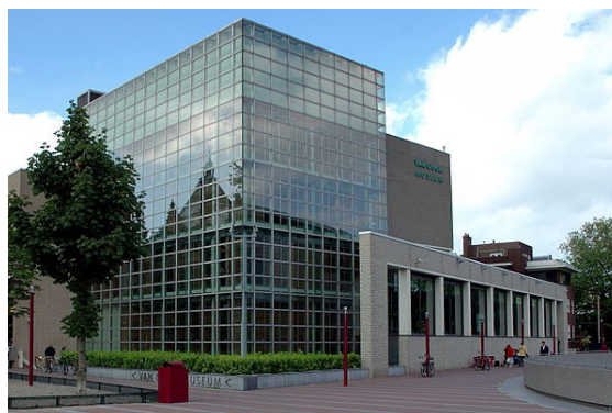
Het Van Gogh Museum, jarenlang het drukstbezochte museum van Amsterdam.