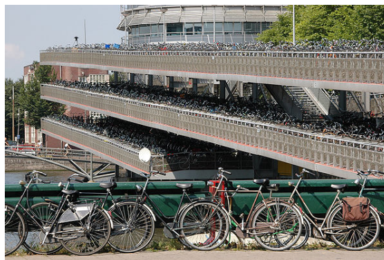
De fietsflat bij het Centraal Station

Amsterdam staat erom bekend dat er goede faciliteiten zijn voor fietsers. Er zijn ruim 881.000 fietsen [40] in de