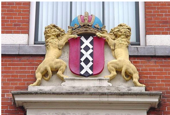
Het wapen van Amsterdam met de blauwe Keizerskroon.

Amsterdam heeft een traditie van tolerantie. Deze is geworteld in de noodzaak nieuwe bewoners van het platteland, uit andere steden en andere landen toe te laten om verzekerd te zijn van voldoende arbeidskracht, kennis, innovatie, geld etc. Zo lieten de regenten in de 17e en 18e eeuw katholieken, lutheranen en andere protestanten, joden en vrijdenkers een voor die tijd ongekende ruimte lieten, met een bijbehorende vrijheid van drukpers. Golven van immigranten hebben zich mede daarom in Amsterdam gevestigd.