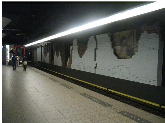
Een kunstwerk ter herdenking van de Nieuwmarkttrains.

De meeste schade werd veroorzaakt in 1943 tijdens de Bombardementen op Amsterdam-Noord , waarbij ruim 200 mensen omkwamen.