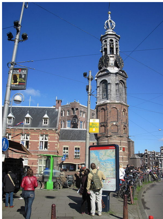
Toeristen bij de Munttoren.

Het toerisme in Amsterdam is belangrijk voor de stad; elk jaar wordt het door zo'n 4,5 miljoen mensen van over de hele wereld bezocht. Hiermee is het de op vier na vaakst bezochte stad van Europa. Ook komen er jaarlijks een kleine 16 miljoen dagjesmensen naar Amsterdam. De stad is weer terug van weggeweest waar het gaat om de populariteit onder Nederlandse jongeren. Onder hen zijn vooral de vele winkels, de horeca en de culturele instellingen en evenementen een reden voor een bezoek.