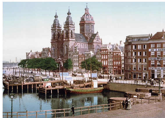
De Sint-Nicolaaskerk rond 1900 - Sint Nicolaas is de beschermheilige van Amsterdam

Een meerderheid van de Amsterdammers, 56%, verklaarde in 2000 in een enquête zich "niet verwant te voelen" aan een kerkgenootschap of religieuze of levensbeschouwelijke stroming. De religies met de meeste aanhang zijn het christendom (17%) en de islam (14%). De gemeentelijke enquête betrof de identificatie en het "gevoel van verwantschap". Bij een onderzoek van het Amsterdamse Bureau voor Onderzoek en Statistiek werd de verwachting uitgesproken dat de islam vanwege de groei van de Marokkaanse en Turkse bevolking binnen enkele jaren de grootste godsdienst zou zijn. [21]