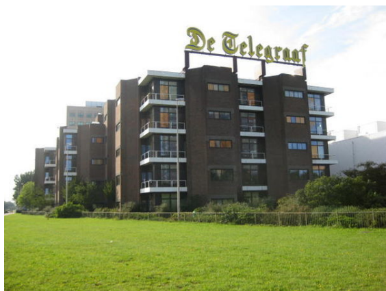
Hoofdkantoor van De Telegraaf.

Het Parool , opgericht tijdens de Tweede Wereldoorlog als verzetskrant, is een landelijk versijnd dagblad, maar met de nadruk op Amsterdam; de oplage ligt boven de 85.000. Verder is De Groene Amsterdammer een veel gelezen Amsterdams weekblad. Het Algemeen Handelsblad , waar later het NRC Handelsblad (te Rotterdam) uit voortkwam, werd opgericht in Amsterdam (en is in december 2012 daar teruggekeerd) en ook nu nog hebben veel kranten de hoofdredactie in de stad: De Telegraaf , de Volkskrant , Trouw , NRC Media en Het Financieele Dagblad zijn alle gevestigd in Amsterdam, evenals de gratis kranten Metro en Sp!ts . Ook uitgeverij Elsevier, onder meer verantwoordelijk voor het gelijknamige opinieweekblad, zetelt in Amsterdam.