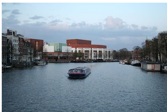
De Stopera, het stadhuis van Amsterdam sinds 1988.