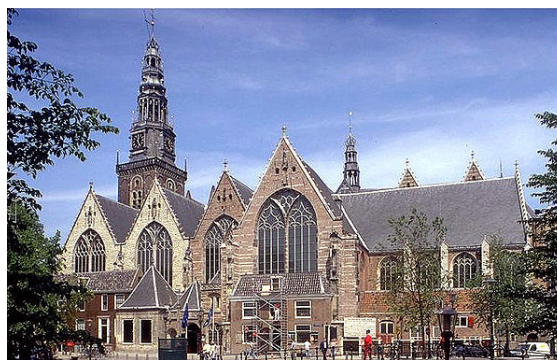
De Oude Kerk is het oudste nog bestaande gebouw van de stad

In de 13e eeuw leidde dit tot aanleg van dijken langs de Zuiderzee en het IJ zoals de Spaarndammerdijk en Diemerzeedijk. In de monding van de Amstel werd, vermoedelijk kort na de overstromingen van 1170 en 1173, de dam aangelegd waar Amsterdam zijn naam aan ontleent. [9] Een deel van de Amstel zou gegraven kunnen zijn. Het deel van de rivier buitengaats, het Damrak, was het begin van de Amsterdamse haven. De rivier aan de andere kant van de Dam werd, deels drooggelegd, het Rokin. Begin 20e eeuw zijn restanten van die dam aangekomen op de plek tussen het Nationaal Monument en het gebouw van De Bijenkorf.