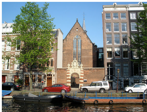
De Agnietenkapel, bakermat van de Universiteit van Amsterdam.

Amsterdam telt twee universiteiten: de Universiteit van Amsterdam (UvA) met ongeveer 28.000 studenten en de Vrije Universiteit, vaak kortweg "VU" genoemd, met ongeveer 19.000 studenten. De faculteiten van de Uva zijn verspreid over de binnenstad van Amsterdam gevestigd, terwijl het complex van de VU aan de De Boelelaan in Buitenveldert huist.