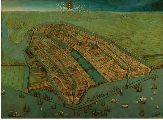
Amsterdam in 1538

De stad kreeg al snel een traditie van burgerlijk bestuur, met een belangrijke rol voor de vroedschap: een college van vooraanstaande burgers die de meeste bestuurders benoemden.