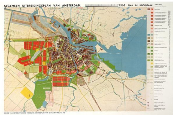
Plankaart van het Algemeen Uitbreidingsplan uit 1935

In de 19e eeuw was er een langzaam herstel en omstreeks 1850 begon Amsterdam zich uit te breiden buiten de 17e-eeuwse Singelgracht. In 1825 kwam met het nieuw-gegraven Noordhollandsch Kanaal de waterverbinding met Den Helder tot stand. In 1839 werd het traject Amsterdam - Haarlem geopend als eerste spoorweg van Nederland. Sinds 1876 is het Noordzeekanaal de rechtstreekse verbinding tussen de Amsterdamse haven en de sluisen bij IJmuiden die toegang geven tot de Noordzee.