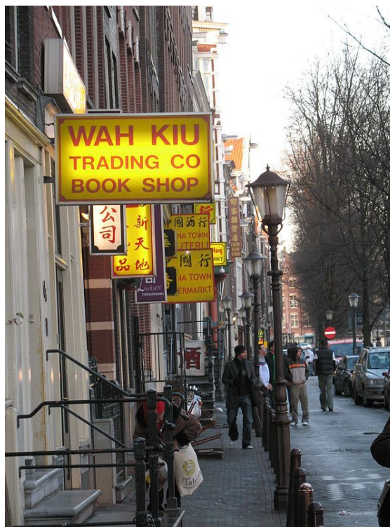
De Chinatown van Amsterdam

Amsterdam kent van oudsher een bevolking die steeds weer nieuwe groepen buitenlanders opneemt en integreert tot een nieuwe autochtone eenheid. Om verschillende redenen kwamen vanuit vele landen mensen naar de hoofdstad: Fransen (hugenoten), (protestantse) Vlamingen, Brabanders, Spaans-Portugese en Oost-Europese Joden. Zij zochten de tolerantie van de stad, Amsterdam kende al vroeg de vrijheid van godsdienst. Ook kwamen velen ze af op de werkgelegenheid: Friezen, Duitsers en Scandinaviërs. Van de 15e tot de 19e eeuw waren inwoners uit het Duitse Rijk de grootste groep immigranten in Amsterdam. In 2010 kwamen de meeste mensen die zich nieuw vestigden uit Groot-Brittannië, de Verenigde Staten en India.