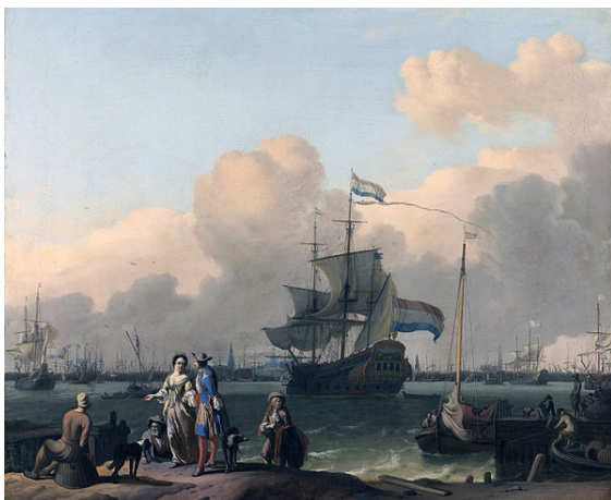
"Het IJ voor Amsterdam met het fregat 'De Ploeg'", schilderij van Ludolf Bakhuizen; omstreeks 1690.

De bevolking van Amsterdam nam in die periode snel toe door een explosieve toestroom van buitenlanders. Omstreeks 1570 telde Amsterdam minder dan 30.000 inwoners, in 1622 was hun aantal gegroeid tot ruim 100.000. Tegen het einde van de 17e eeuw overschreed het inwonertal de 200.000 en behoorde Amsterdam met Londen, Napels en Parijs tot de grootste steden in Europa. De bevolkingsgroei maakte een grootschalige uitbreiding van de stad noodzakelijk, waaraan de concentrische grachtengordel met zijn koopmanshuizen en pakhuizen te danken is.