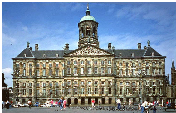
Het paleis op de Dam, gebouwd als stadhuis van Amsterdam.