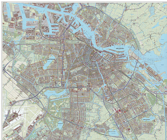
Topografische kaart van Amsterdam (woonplaats), maart 2014