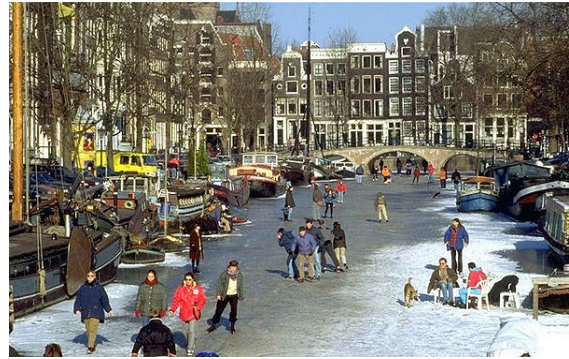
Schaatsers op de Keizersgracht.

Amsterdam ligt in een gebied met een gematigd zeeklimaat, waarbij de weerpatronen sterk worden beïnvloed door de nabijheid van de Noordzee in het westen en de daarmee gepaard gaande noordwestenwinden en stormen. De wintertemperaturen zijn er mild; gemiddeld boven nul, al is vorst niet ongewoon tijdens vlagen van oostelijke of noordoostelijke wind vanuit het Europese binnenland, zoals uit Scandinavië, Rusland en zelfs Siberië. De zomers zijn er warm, maar zelden heet.