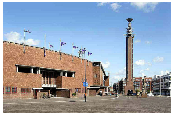
Het Olympisch Stadion

Amsterdam telt een aantal grote sportclubs. Het bekendst is de voetbalclub AFC Ajax, die onder meer 33 landstitels en vier Europa Cups 1 op haar naam heeft staan. De thuishaven van de Eredivisieclub is de Amsterdam ArenA, dat in 1996 het stadion De Meer verving en met een capaciteit van ruim 50.000 het grootste stadion van Nederland is. Onder meer het ijshockeyteam Amstel Tijgers, het honkbalteam Amsterdam Pirates, het basketbalteam BC Apollo en de hockeyteams Amsterdamsche H&BC en Pinoké komen eveneens uit op het hoogste niveau binnen hun sporttak, evenals de americanfootballteams Amsterdam Crusaders en Amsterdam Panthers. Americanfootballteam Amsterdam Admirals deed vanaf de oprichting in 1995 mee aan de NFL Europe, maar hield bij de opheffing van die competitie in 2007 op te bestaan.