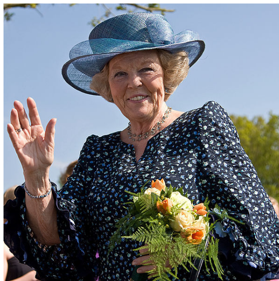
Koningin Beatrix tijdens een bezoek aan Vries in 2008

Op 28 januari 2013 kondigde de koningin in een korte tv-toespraak haar abdicatie aan op 30 april 2013. Zij gaf aan dat zij het een goed moment vond om af te treden, aangezien zij in 2013 75 jaar zou worden en later dat jaar herdacht zou worden dat Nederland tweehonderd jaar een koninkrijk is. [48] Daarnaast gaf zij aan, dat de verantwoordelijkheid van het land “in handen van een nieuwe generatie moet liggen”. Beatrix beklemtoonde dat zij niet afrad omdat de taak haar te zwaar zou zijn geworden, de reden die haar moeder gaf toen die in 1980 haar troonsafstand aankondigde. De troonopvolger was haar oudste zoon Willem-Alexander. [49]