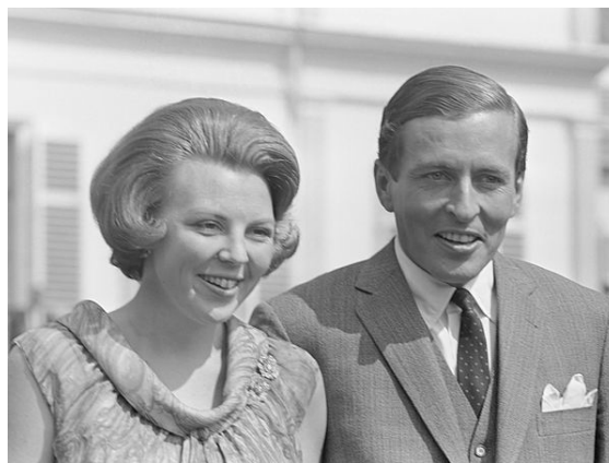
Prinses Beatrix en Claus von Amsberg in de tuin van Paleis Soestdijk op 28 juni 1965, de dag van hun verloving

Er ontstond grote commotie toen bleek dat Claus een Duitser was en lid was geweest van de Hitlerjugend. Een