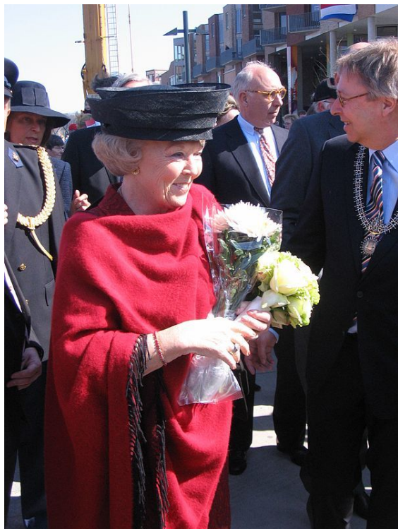
Koningin Beatrix in het vernieuwde Roombeek, 22 april 2008

Lange tijd bleef de koninklijke familie schandaalvrij. Eind jaren negentig veranderde dit. De publieke opinie begon zich af en toe tegen Beatrix te keren en in populairere landelijke roddelbladen werd zij afgeschilderd als een “boze schoonmoeder” die niet zou willen dat haar zoon Willem-Alexander ging trouwen met diegene die hij wilde.