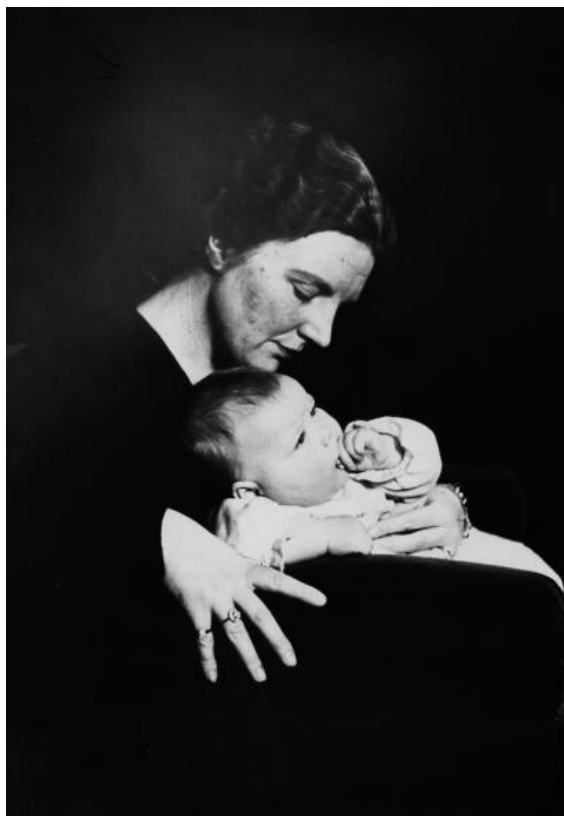
Beatrix met haar moeder

Half juni 1937 maakte Juliana tijdens een korte radiotoespraak vanuit paleis Soestdijk in Baarn haar eerste zwangerschap openbaar. Na afloop van een feestelijke ontvangst in Amsterdam zei de kroonprinses in een dankwoord aan de Amsterdamse burgerij het volgende: “Nooit had iets mij kunnen weerhouden alle delen van het programma mee te maken, waren het niet - op zichzelf verheugende - gezondheidsredenen geweest, die u zeker wilt verstaan en billijken”. [3][4][5]