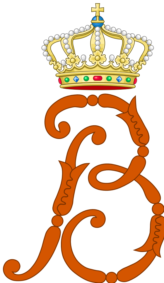
Monogram van koningin Beatrix

Beatrix heeft een warme belangstelling voor kunst. Jaarlijks reikte zij de koninklijke subsidies voor