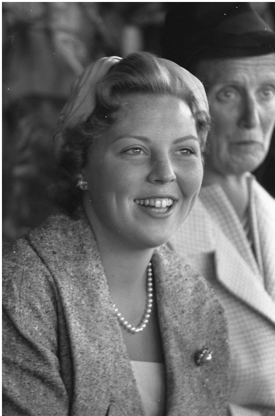
Beatrix na haar terugkomst uit Amerika in 1959

Tweeënhalf jaar na haar geboorte vielen op 10 mei 1940 de Duitsers Nederland binnen en werd het land betrokken bij de Tweede Wereldoorlog. Met haar grootmoeder koningin Wilhelmina, haar ouders en zusje Irene vluchtte Beatrix na enkele dagen met de boot naar Engeland. In juni reisde zij met haar moeder en Irene door naar Canada, waar zij de rest van de oorlog bleef wonen. [15] In de zomer van 1945 keerde het gezin, uitgebreid met Margriet die in 1943 in Canada was geboren, terug naar Nederland en nam opnieuw zijn intrek in paleis Soestdijk.