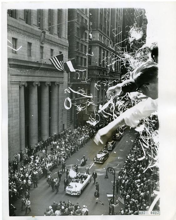
Beatrix bezocht in 1959 de stad New York, 350 jaar na Henry Hudson en werd verwelkomd met een ticker-tape parade

ofwel: “Ik heb enorm genoten van die trip, omdat ik het gevoel had dat ik met mijn eigen soort mensen was en mijzelf kon zijn”. [18] De uitspraak “mijn eigen soort mensen” leidde in het koninkrijk tot een storm van verontwaardiging. Terug op vaderlandse bodem gaf zij op Schiphol haar eerste persconferentie waar Nederlandse verslaggevers vrijelijk vragen konden stellen. Zij weet de consternatie aan een misverstand over de intonatie en aan een verkeerde vertaling. Volgens haar bedoelde zij met “ my own people ” “een eigen familiekring, een eigen sfeer, een kring van vakgenoten” en de uitspraak was niet bedoeld “om een bepaalde standing uit te drukken”. [19]