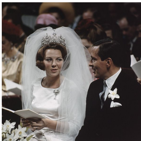
Huwelijk (10 maart 1966)