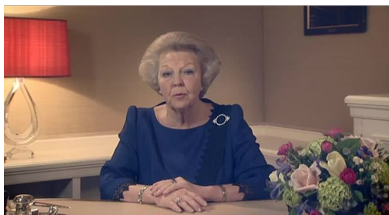
De Koningin kondigt haar aftreden aan op de Nederlandse televisie