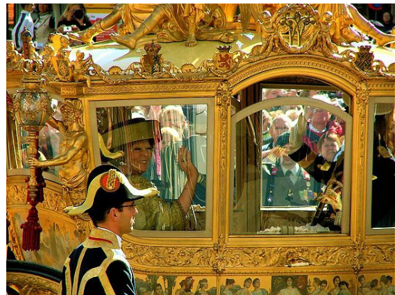
Koningin Beatrix tijdens Prinsjesdag in de Gouden Koets

Op 30 april 2005 vierde Beatrix haar 25-jarig regeringsjubileum met een bijeenkomst in de Ridderzaal te Den Haag waar naast de koninklijke familie en het kabinet ook vrijwel alle parlementariërs en veel andere officiële vertegenwoordigers van het Nederlandse volk aanwezig waren.