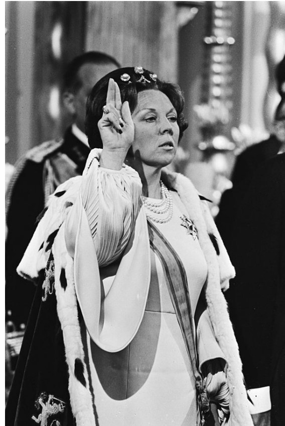
Koningin Beatrix tijdens haar eedaflegging in de Nieuwe Kerk

Dat Beatrix haar moeder als koningin zou opvolgen, was bij haar geboorte geen vanzelfsprekendheid. Pas in 1983 is de Grondwet dusdanig gewijzigd dat het oudste kind van het staatshoofd de wettige troonopvolger wordt. Tot dan was geregeld dat de oudste zoon altijd voorrang kreeg op een dochter. Pas nadat Juliana biologisch gezien geen kinderen meer kon krijgen, had Beatrix zekerheid dat zij de beoogd opvolgster was.