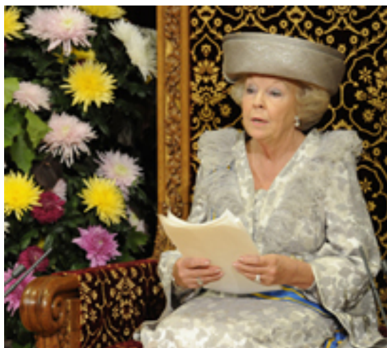
Koningin Beatrix tijdens het voorlezen van de troonrede van 2011

Beatrix' nichtje, prinses Margarita , dochter van haar zuster Irene , verweet in 2003 de koningin en andere familieleden treiterijen en af luisterpraktijken tegen haar en haar echtgenoot Edwin de Roy van Zuydewijn . Volgens de prinses en haar man had de koninklijke familie er onder meer voor gezorgd dat het bedrijf van De Roy van Zuydewijn een belangrijke order was misgelopen, waardoor het failliet was gegaan. In het opinietijdschrift HP/De Tijd fulmineerde het echtpaar tegen meerdere leden van de koninklijke familie. Ook gaf het echtpaar televisie-interviews.