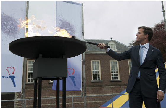
Minister-president Mark Rutte ontsteekt het Bevrijdingsvuur in Breda (2012)

Door het gehele land worden activiteiten georganiseerd; elke stad en plaats heeft zijn eigen activiteitenprogramma waaronder veel muziekfestiviteiten.