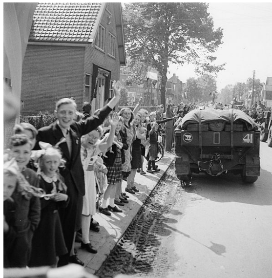
Intocht van Canadese militairen in Utrecht

Na de bevrijding in 1945 werd bepaald dat Bevrijdingsdag om de vijf jaren gevierd zou worden. Pas in 1990 werd de datum van 5 mei uitgeroepen tot een nationale