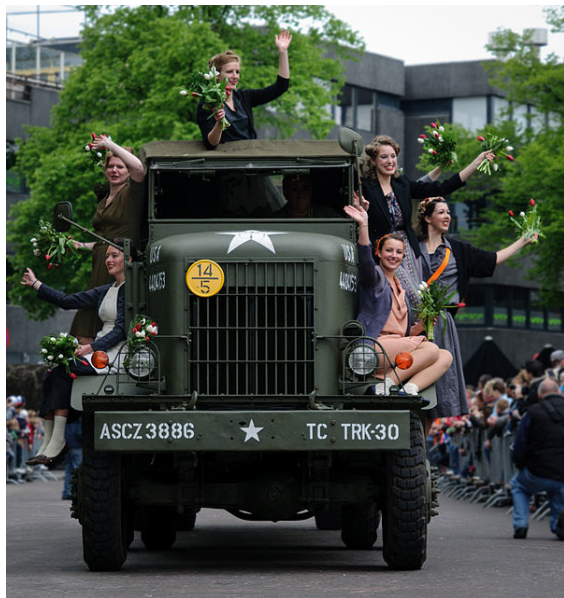
5 mei 2010 in Enschede

Bevrijdingsdag is de nationale feestdag op 5 mei waarop de bevrijding van de Duitse bezetting in Nederland in 1945 wordt gevierd. Op deze dag wordt ook de bevrijding van het toenmalig Nederlands-Indië gevierd. Nederland staat op 5 mei ook stil bij de grote waarde van vrijheid, democratie en mensenrechten.