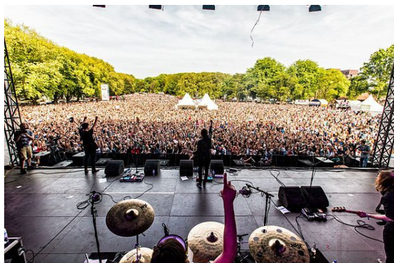
Bevrijdingsfestival Utrecht in 2014

het Bevrijdingsfestival Overijssel te Zwolle. Sinds 1991 worden door het Nationaal Comité 4 en 5 mei Nederlandse artiesten aangesteld als 'Ambassadeurs van de Vrijheid' en per helikopter van festival naar festival vervoerd.