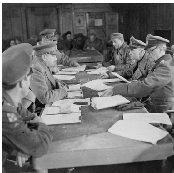
Bespreking van het capitulatiedocument in Wageningen

feestdag, waarop jaarlijks de bevrijding van het Nederlandse koninkrijk in 1945 van de Duitse en Japanse bezetting wordt herdacht en gevierd. In 1999 werd 15 augustus, de dag van de Japanse capitulatie in 1945, tevens een dag waarop uitgebreid gevlagd mag worden. De datum van 5 mei als nationale feestdag is ook vastgelegd in de Algemene Termijnenwet.