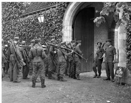
Ontwapening van Duitse soldaten door het 1e Canadese Corps in Amsterdam, 9 mei 1945

Andere Europese landen vieren 8 mei, de Victory of Europe Day , de dag waarop Duitsland in 1945 officieel capituleerde. Van de meeste landen was hun territorium al eerder ontzet. In de voormalige Oostbloklanden wordt 9 mei als Dag van de Overwinning gevierd. In Europa was toen de Tweede Wereldoorlog afgelopen, maar hij werd pas wereldwijd op 15 augustus 1945 beëindigd met de overgave van Japan als laatste asmogendheid . De formele, schriftelijke capitulatie van Japan vond plaats op 2 september 1945. Deze data worden aangehouden door de landen die betrokken waren in het Aziatische deel van de Tweede Wereldoorlog als de Victory of Japan Day .