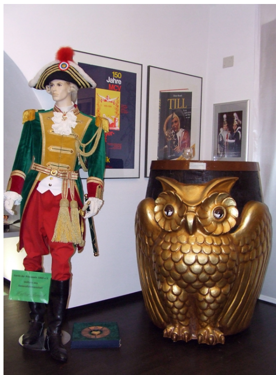
Uniform van de Generalfeldmarschall" der „Garde der Prinzesin (1886) en een "Bütt" (biervat, zie ook tonpraten) uit Mainz