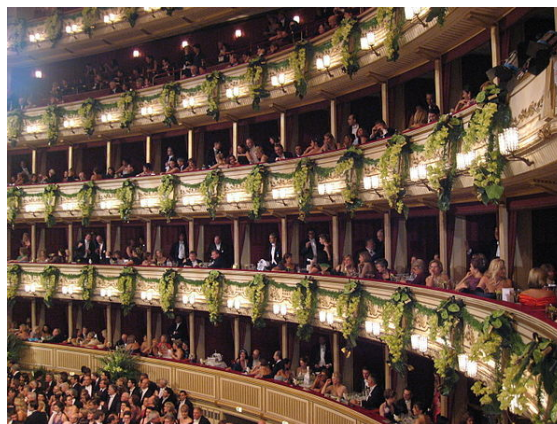
Met bloemen versierde Weense Staatsopera tijdens de Opernball

Het carnaval in Oostenrijk, Fasching genoemd, heeft geheel eigen gebruiken. In dat land is het carnivalsseizoen de tijd van de bals, met name in Wenen. Elke beroepsgroep heeft zijn eigen dansfeest, zoals het Zuckerbäckerball, Jägerball of het Schulwartenball. Hoogtepunt is het Opernball . Het is het bal van de kunstenaars van de Weense Opera, en tegelijkertijd het bal van iedereen die