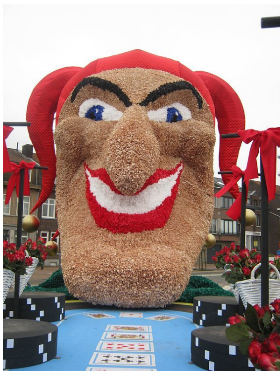
Maaseikse prinsenwagen van 2013

In België wordt carnaval bijna overal gevierd. Carnaval wordt gevierd van zondag tot woensdag, en in sommige steden vindt op woensdag een 'popverbranding' plaats. Er lopen tijdens carnaval soms wel 70 groepen door de straten. Traditioneel krijgt Prins Carnaval tijdens carnaval de macht over de stad. Als een prins driemaal wordt verkozen, wordt hij in sommige steden keizer. Onder meer in Aalst is er een keizer. Deze zit dan soms ook in de Raad van Elf.