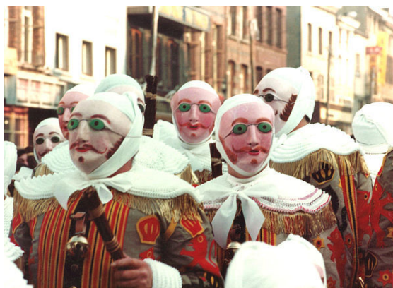
De historische Gilles van het carnaval in Binche

De oudste carnavalsstoet van Vlaanderen (sinds 1865) is de Halfvastenstoet van Maaseik in de provincie Limburg. [4] Een andere oude stoet is die van Herenthout