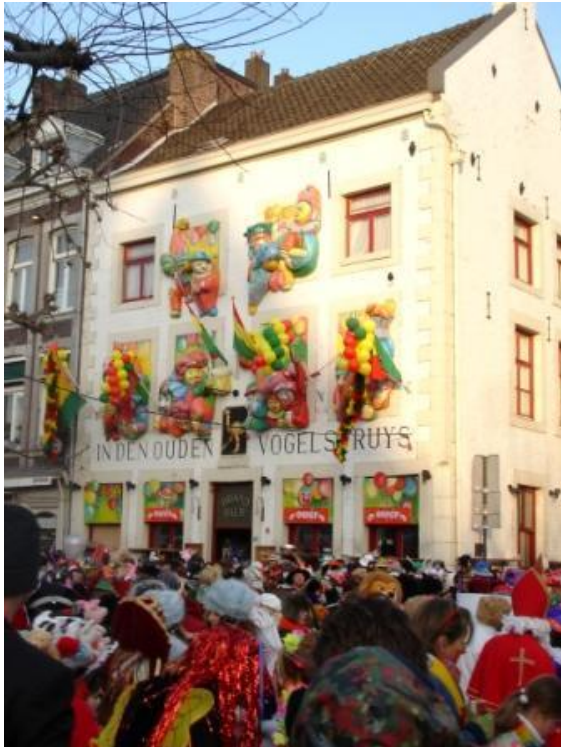
Straatcarnaval in Maastricht