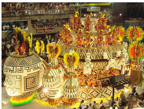
De sambaschool GRES Mocidade Independente de Padre Miguel tijdens de parade van het carnaval in Rio de Janeiro