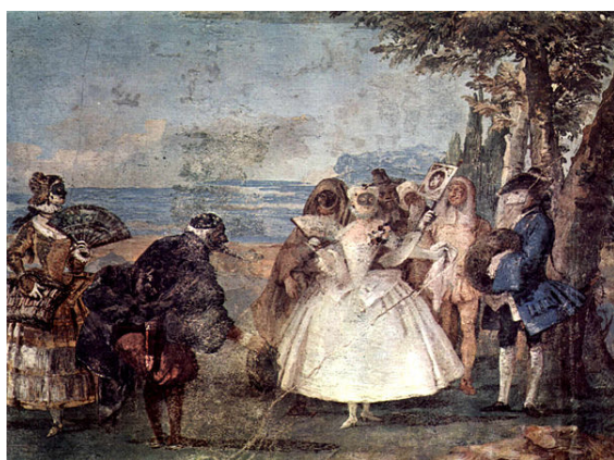
Carnaval van Venetië, Giovanni Domenico Tiepolo, 1757

enorme uitbundigheid. Een (schijnbaar) ongeorganiseerde massa van tienduizenden kleurrijk geklede carnavalsvierders bevolken dan de straten en pleinen van de stad. Opmerkelijk aan het straatcarnaval van Frans Vlaanderen is het veelvuldig gebruik van bontgekleurde paraplu's