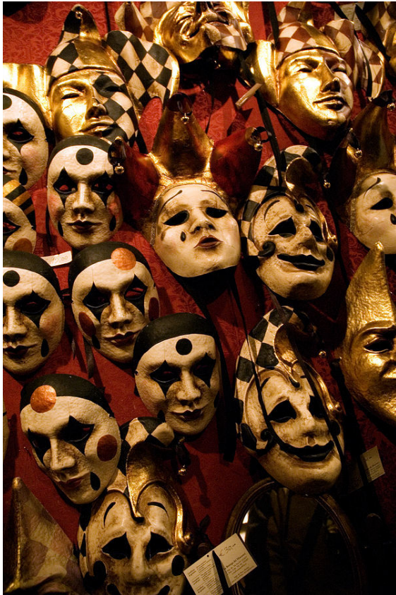
Maskers van het Carnaval van Venetië

waarin men zich beperkte tot het minimaal noodzakelijke.