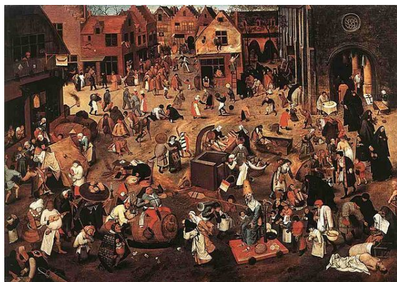
Het gevecht tussen Carnaval en Vastentijd, Pieter Bruegel de Oude, 1559