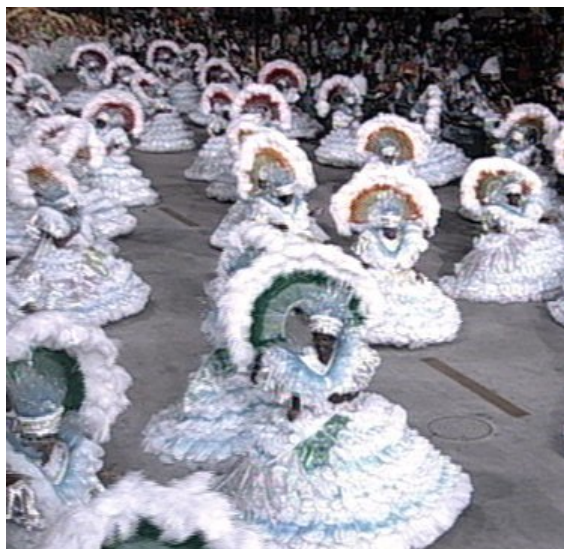
Carnaval in Rio de Janeiro