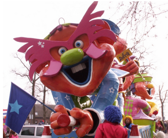
Een praalwagen in de carnavalsoptocht van Soerendonk.