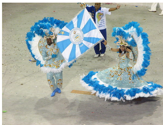
De mestre-sala en de porta-bandeira van Unidos de Vila Isabel tijdens het carnaval in Rio de Janeiro

In Frankrijk is het carnaval van Nice bekend. Het straatcarnaval van Duinkerke karakteriseert zich door een