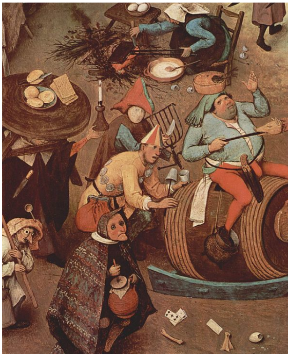
Bourgondisch carnaval door Pieter Bruegel de Oude.

november en het eigenlijke feest al tal van aan carnaval verbonden festiviteiten plaatsvinden, vooral in de laatste weken voor carnaval. Soms vinden er ook op Aswoensdag nog enkele carnavalsactiviteiten plaats.