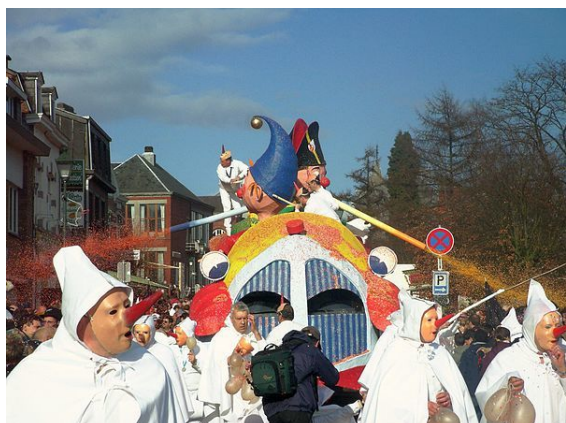
De Blancs-Moussis in Stavelot