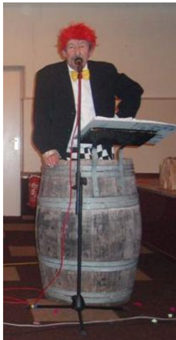
Een Brabantse 'tonpraoter'