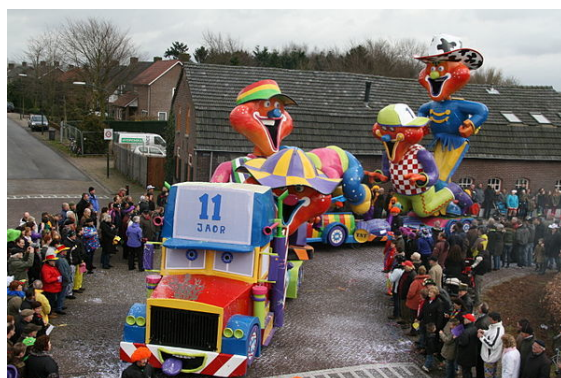
Carnavalswagen regio Noord-Brabant

de drie dagen voorafgaand aan Aswoensdag. Volgens de traditie duurt het feest van zondag tot dinsdagavond - de Vastenavond. Om middernacht vangt de vastentijd aan van 40 dagen, tot Pasen.