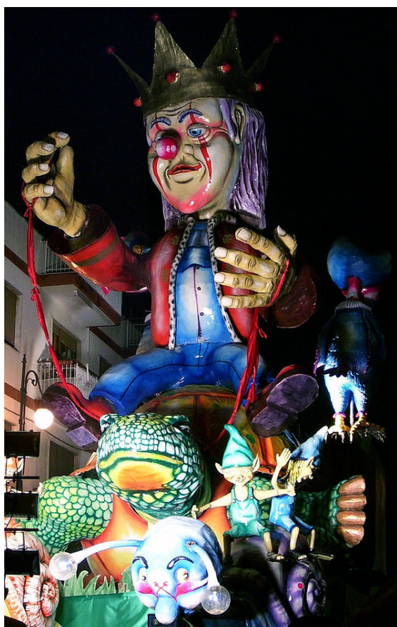
Een carnavalswagen in Massafra