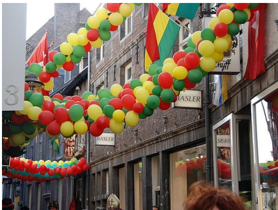
Straatversiering tijdens Carnaval