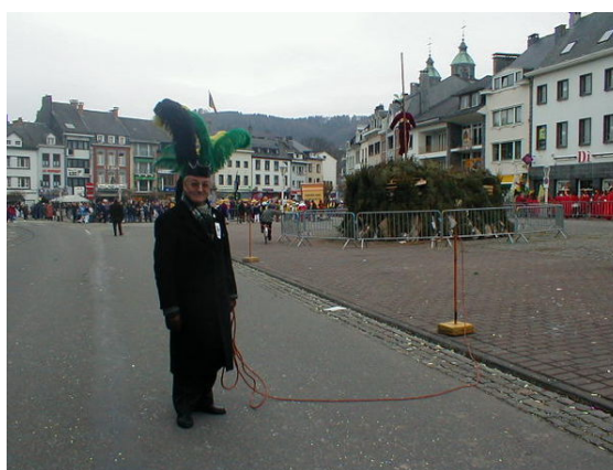
Vorbereiding voor het aansteken van de haguete Malmedy

(sinds 1892). De Herenthoutse carnavalsstoet is gegroeid vanuit het theater en is zich verder blijven profileren als een van straattoneel en dansen. Dit in tegenstelling tot de eerder passieve voorbijtrekkende optochten met het accent op rijkelijk uitgedoste deelnemers en praalwagens. In 1978 bevestigde minister Rika De Backer van Nederlandse cultuur dat Herenthout de oudste georganiseerde Vastenavondstoet van België heeft tot het tegendeel wordt bewezen. Op zondag 9 maart 1851 trok de eerste carnavalsstoet door de straten van Aalst. Dit wordt echter niet erkend omdat dit geen georganiseerde stoet was. Een georganiseerde stoet was er pas in 1923 te Aalst.