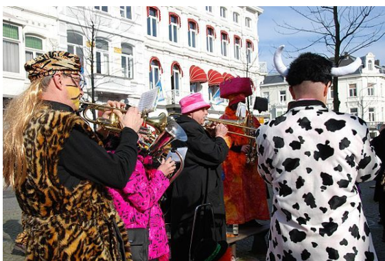
De 'Zaate Hermenie' in Maastricht