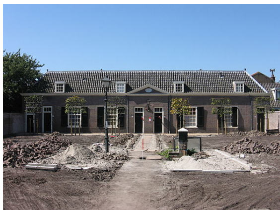
Het Hofje van Pauw