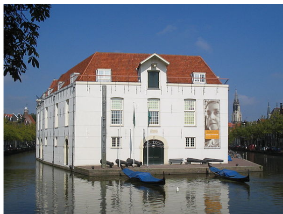
Het voormalige Legermuseum