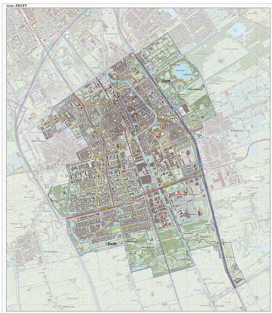
Topografische gemeentekaart van Delft

Het gedeelte Poptahof (buurten Poptahof-Noord en Zuid), nog wel eens gezien als een aparte wijk, is een onderdeel van de wijk Voorhof (Delft).