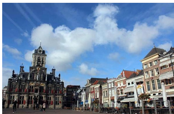
Het Stadhuis aan de Markt