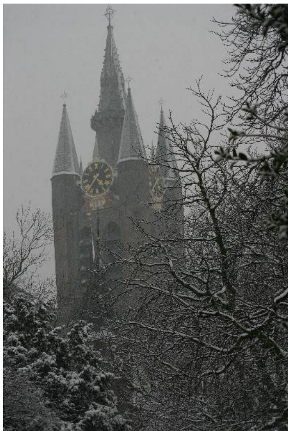
De Oude Kerk