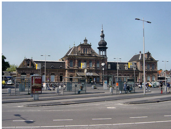
Het oude Station in Delft

De stad ligt ingeklemd tussen de A4 in het westen en noorden, de A13 aan de oostzijde, en de N470 aan de zuidzijde.