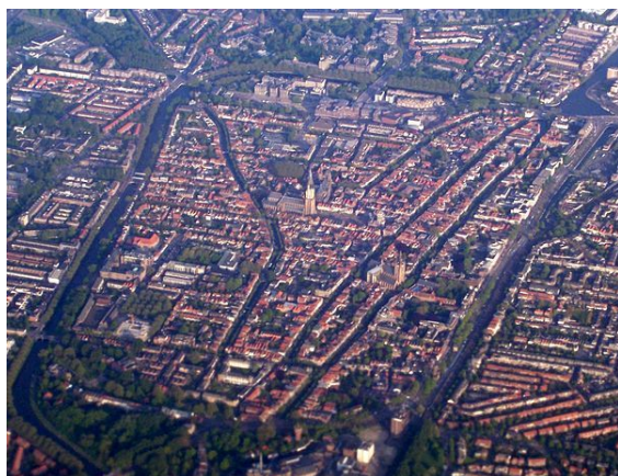
Luchtfoto van Delft vanuit het noorden

Delft heeft een historische binnenstad. Parallel, en grofweg in noord-zuidrichting, lopen de grachten Oude Delft en Nieuwe Delft. Die laatste is beter bekend als