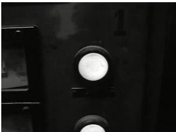
Bioscoopjournaal uit 1976. Aandacht voor het maken van Delfts blauw aardewerk en (vanaf 1:40) de Oude Kunst- en Antiekbeurs in Delft.

Het aardewerk van Delft, het Delfts blauw, is erg bekend. Het is nu nog te zien bij de aardewerkfabrieken De Porceleyne Fles en De Delftse Pauw. Naast de Nieuwe Kerk