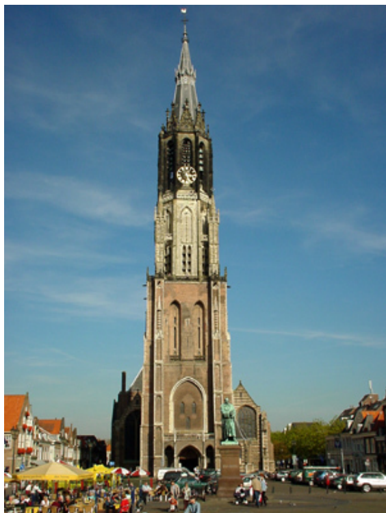
De Nieuwe Kerk