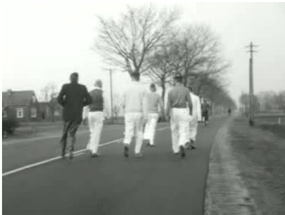
Wandeltocht op sokken door gemeente Emmen in 1960

Emmen ( uitspraak (info / uitleg)) is een gemeente in het zuidoosten van de Nederlandse provincie Drenthe en heeft een oppervlakte van 350 km 2 , waarmee het de grootste gemeente van Drenthe is. Qua oppervlakte is Emmen na Súdwest-Fryslân, Noordoostpolder en Hollands Kroon de vierde gemeente van Nederland. De hoofdstad van de gemeente is het gelijknamige Emmen en op 31 maart 2015, telde de gemeente 107.687 inwoners (bron: CBS)