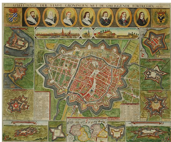
Groningen in de Gouden Eeuw.

(zie : bijgevoegd overzicht). Een deel van de stijging is te danken aan de annexaties die in de loop der tijd plaatsvonden. Zo werd in 1884 een stuk van de gemeente Haren geannexeerd rond de Van Mesdagkliniek, waarbij de grens ten zuiden van de Helperlinie werd gelegd. In de jaren 1910 werd een aantal annexaties gepleegd in het kader van de bouw van een aantal woonwijken (ongeveer 1000 hectare in totaal): Kostverloren (van Hoogkerk) in 1912, De Hoogte (van Noorddijk) in 1914 en Helpman (van Haren) in 1915. In 1969 werden de hele gemeenten Noorddijk en Hoogkerk en delen van de gemeenten Adorp , Bedum en Haren toegevoegd aan het grondgebied van Groningen. Deze enorme annexatie omvatte de dorpen en gehuchten Bangeweer , Dorkwerd , Eelderwolde (het deel dat daarvoor onder Haren viel), Engelbert , Euvelgunne , Harssens (deels), Hoogkerk , Kinderverlaat , Kleiwerd , Koningspoort , Leegkerk , Middelbert , Noorddijk , Noorderhoogebrug , Oosterhoogebrug , Oude Harssens (deels), Oude Roodhaan , Pannekoek , Paddepoel (deels), Peizerweg , De Poffert (deels), Roodehaan , Ruischerbrug , Selwerd , Slaperstil , Vierverlaten en Zuidwending . In 1987 werd een deel van het gehucht Matsloot geannexeerd van de Drentse gemeente Roden . In 1998 werd Bruilweering geannexeerd van de Drentse gemeente Eelde . In 2012 werd een ruil van grondgebied met de gemeente Slochteren (De plaatsen Engelbert en Middelbert tegen de bouwgrond van de plaats Meerstad ) voorgesteld maar vervolgens weer afgeblazen.