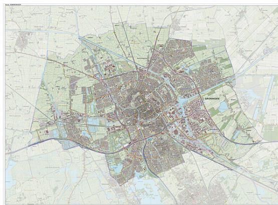
Topografische gemeentekaart van Groningen, september 2014

De gemeente Groningen is ingedeeld in vijf stadsdelen: Binnenstad , Oude wijken , Noordwest/Hoogkerk , Noorddijk en Zuid . Hiervan behoren Binnenstad , Oude wijken en Zuid geheel tot de Stad Groningen, de stadsdelen Noordwest/Hoogkerk en Noorddijk bevatten ook andere kernen