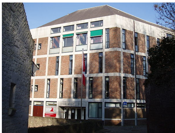
Conservatorium Maastricht in het Jekerkwartier

Maastricht is een echte studentenstad. Dit komt vooral door de aanwezigheid van de Universiteit Maastricht (UM), met 16.000 studenten (in 2011) de grootste onderwijsinstelling in Limburg. De in 1976 opgerichte universiteit is internationaal georiënteerd en scoort met de meeste opleidingen hoog in de diverse rankings . [20] Aan de universiteit gelieerde opleidingen zijn het University College Maastricht en de Maastricht School of Management. Daarnaast is in Maastricht het postacademisch kunstinstituut Jan van Eyck Academie gevestigd.