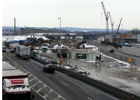
Bouw Koning Willem-Alexandertunnel (Europaplein)