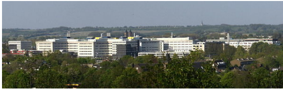
Het Academisch Ziekenhuis Maastricht vanaf de Sint-Pietersberg

wijze') daarin een rol. [21] Door de vergrijzing in dit deel van Nederland, zijn er relatief veel ouderen, die relatief vaak gebruikmaken van zorginstellingen.