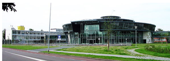
Leeuwenborgh Opleidingen (MBO) in Scharn

de Hotel Management School Maastricht, de Academie Verloskunde Maastricht, de PABO Maastricht, de Academie Beeldende Kunsten Maastricht, de Academie van Bouwkunst Maastricht, het Conservatorium Maastricht en de Toneelacademie Maastricht. Enkele van deze opleidingen genieten grote faam en trekken studenten uit het hele land en het nabije buitenland. In het Jekerkwartier zijn een aantal kunstopleidingen en universitaire instellingen gevestigd, zodat dit deel van het centrum zich heeft ontwikkeld tot een Maastrichts Quartier Latin . De medische opleidingen van zowel de Universiteit Maastricht als de Hogeschool Zuyd zijn gehuisvest op de campus Randwyck.