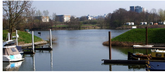
Waterrecreatie langs de Maas in Sint Pieter

De sportparticipatie in Maastricht ligt al vele jaren onder het landelijk gemiddelde. Voor jongeren onder de 18 ligt het juist hoger. [22] In de Spormota Mee(r)bewegen 2020 stelt de gemeente Maastricht zich ten doel het sporten in de stad te bevorderen (minimaal 65%, het landelijk gemiddelde). [23] Tegelijkertijd zien veel sportclubs zich gedwongen te fuseren door teruglopende ledentallen. Het