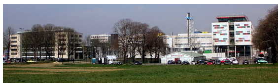
Campus Randwyck van de Universiteit Maastricht