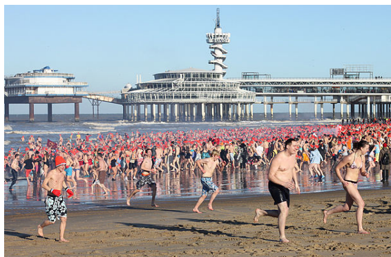
Nieuwjaarsduik te Scheveningen.

namen deze keer 36.000 mensen een duik. Dit is mede te danken aan het record-warme zachte weer (13 graden C) en het relatief warme zeewater van deze Nieuwjaarsdag.