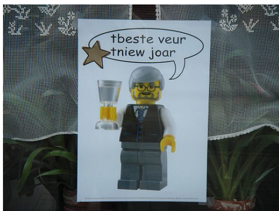
Nieujaarswensen in de stad Gent. De affiches werden door het stadsbestuur uitgedeeld.

Men ziet de periode van kerst tot Driekoningen (de heidense twaalf nachten) tegenwoordig nog steeds als