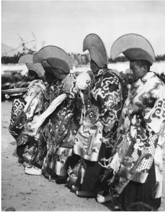
Lama's op weg naar een nieuwjaarsfeest, foto genomen tijdens Tibetexpeditie in 1938

Nieuwjaar is de dag waarop het begin van het nieuwe jaar wordt gevierd. In de westerse wereld is dit op 1 januari, in andere culturen vaak op andere data. Bij deze viering zijn wederzijdse gelukwensen en goede voornemens gebruikelijk.