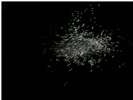
Nieuwjaar 1971 in het Polygoonjournaal