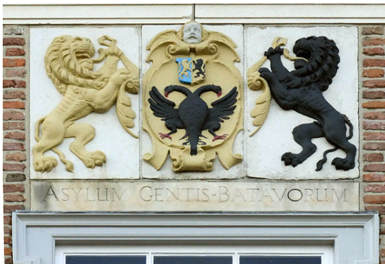
Gewelsteen met het wapen van Tiel, Waterpoort

Tiel ( uitspraak (info / uitleg)) is een stad (Hanzestad) en gemeente in de Nederlandse provincie Gelderland. De gemeente telt per 31 mei 2015 41.650 inwoners (bron: CBS) en heeft een oppervlakte van 34,81 km 2 (waarvan 2,17 km 2 water).