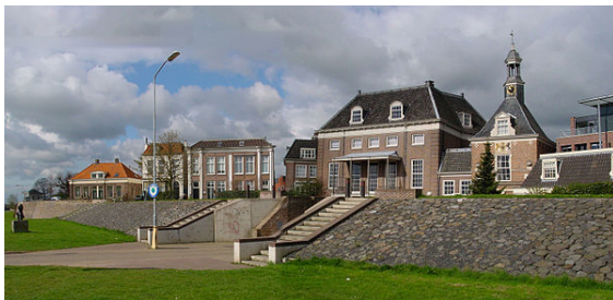
Waterpoort met coupure Havendijk