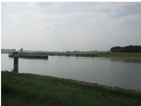
Tiel vanuit het oosten met op de achtergrond de toren van de Sint-Maartenskerk

Volgens de Benedictijnse kroniekschrijver Alpertus van Metz werd Tiel geplunderd door Vikingen. Hij schreef dat zeeroevers zonder enige tegenstand te ontmoeten in 1006 de handelsnederzetting binnentrokken, de levens-