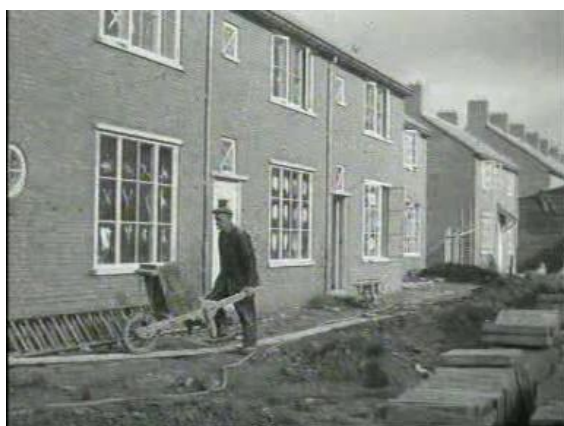
Polygoon-journaal over het na de Tweede Wereldoorlog vijftigduizendste nieuwgebouwde huis in Nederland (in Tiel), 1949

In het oude stadscentrum herinneren vele monumenten aan dat rijke verleden, zoals de Sint-Maartenskerk, de Waterpoort met Grote Sociëteit, het Kantongerecht, de voormalige sociëteit Bellevue, het uit 1525 daterende Ambtmanshuis dat samen met de door Jan David Zocher ontworpen Ambtmanstuin deel uitmaakt van het stadhuis-complex, en het eveneens uit de 16e eeuw stammende Gotische huis aan de Weerstraat.