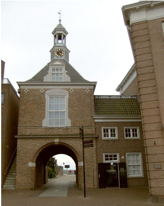
De poortoren "Waterpoort" is een restant van de vestingwerken