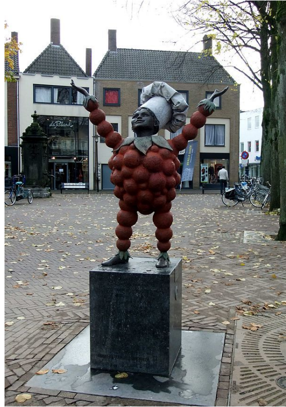
Beeldje van Flipje

De mascotte van de stad is Flipje, het fruitbaasje (de stripfiguur van de voormalige lokale jamfabriek De Betuwe). Van Flipje staat een standbeeld in de stad.