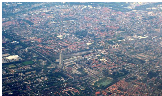
Tilburg vanuit de lucht