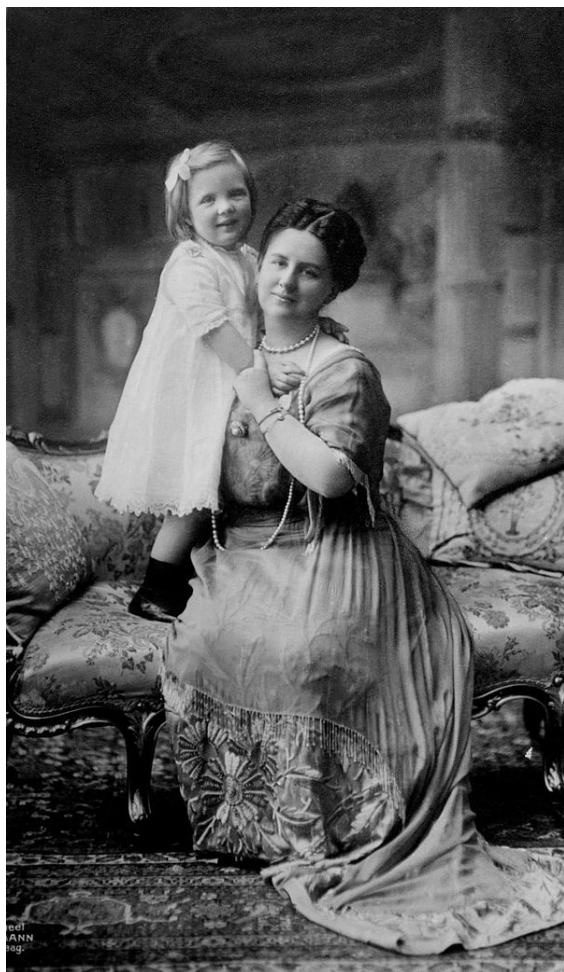
Wilhelmina met Juliana, circa 1914.

waren ontmoetingen gearrangeerd met drie kandidaten. Friedrich Wilhelm van Pruisen, kleinzoon van prinses Marianne, was door de Duitse keizer naar voren geschoven en de twee broers van Mecklenburg-Schwerin, zonen van groothertog Frederik Frans II van Mecklenburg-Schwerin, waren geselecteerd uit de Almanach de Gotha . Van de broers kwam alleen Heinrich opdagen. Moeder en dochter kozen voor hertog Heinrich zu Mecklenburg-Schwerin. Op 16 oktober werd de verloving bekendgemaakt. Wilhelmina en Heinrich waren familie van elkaar: de Russische tsaar Paul I en diens echtgenote Maria Fjodorovna waren hun gemeenschappelijke overgrootouders, wat hen achterneef en -nicht van elkaar maakte.