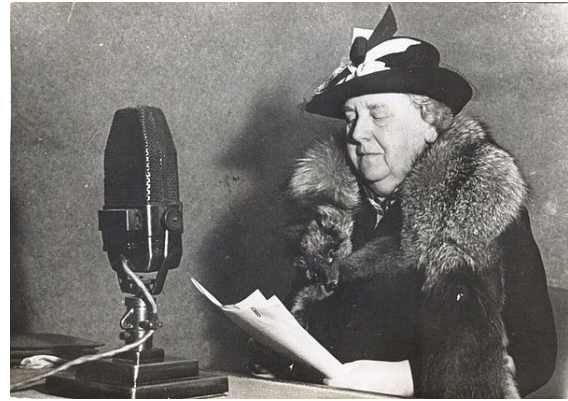
Koningin Wilhelmina spreekt tot het volk via Radio Oranje.

Op 10 mei 1940 viel Duitsland Nederland binnen. De voltallige koninklijke familie vluchtte enkele dagen later naar Londen. Juliana en de kinderen Beatrix en Irene reisden een maand later door naar Canada, teneinde de dynastie veilig te stellen. Ook koningin Wilhelmina week op advies van generaal Henri Winkelman uit. [12] Naar eigen zeggen was haar aanvankelijke plan om met een Engelse