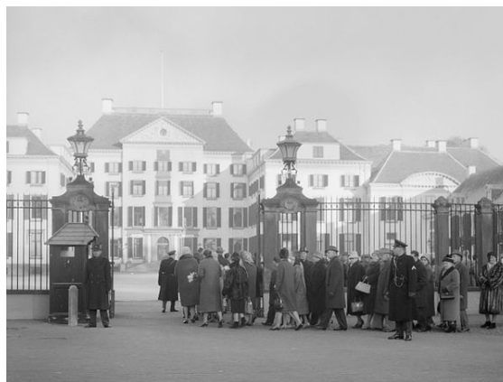
Paleis Het Loo, mensen bewijzen de laatste eer aan prinses Wilhelmina (30 november 1962).

De Rijksvoorlichtingsdienst liet op 22 november 1962 weten dat Wilhelmina's gezondheidstoestand iets achteruit was gegaan. "Reden voor onmiddellijke ongerustheid is er echter niet", was het officiële commentaar. In de nacht van 27 op 28 november overleed zij in haar slaap in Paleis Het Loo aan de gevolgen van een hartaandoening. Direct na haar dood werd bekendgemaakt dat in de laatste weken van Wilhelmina's leven haar gezondheidstoestand veel ernstiger was geweest, dan naar buiten was gebracht. [16] Wilhelmina werd opgebaard in de kapel van Het Loo. Buiten Het Loo trotseerde een lange rij mensen de kou om haar de laatste eer te bewijzen. Haar lichaam werd na een aantal dagen overgebracht naar paleis Huis ten Bosch. [17] Wilhelmina werd op 8 december bijgezet in de grafkelder van Oranje-Nassau in de Nieuwe Kerk in Delft. Conform haar wens, al vastgelegd in 1919, was wit de voorgeschreven kleding bij de begrafenis.