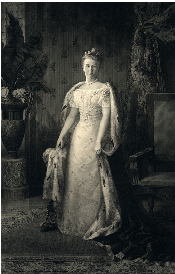
Wilhelmina in 1898