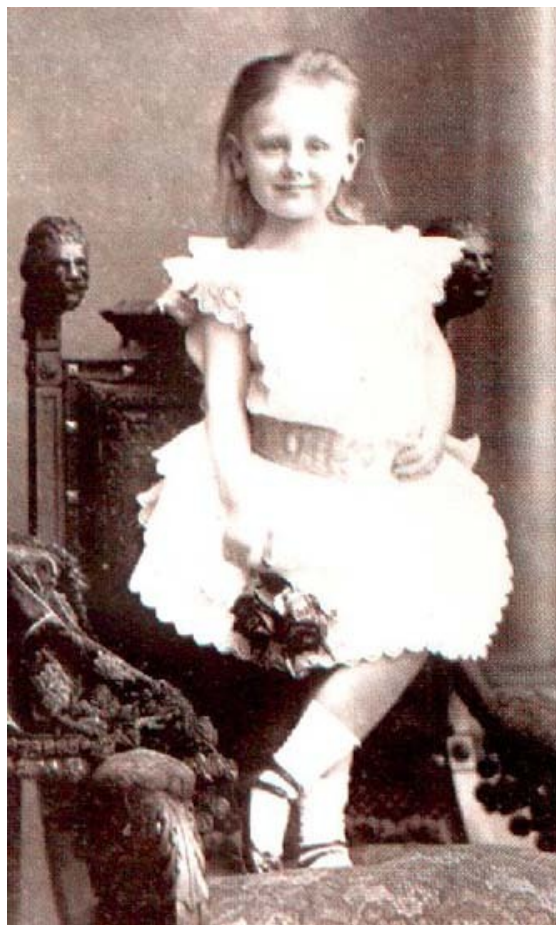
Prinses Wilhelmina in 1885.

De doop vond plaats op 12 oktober 1880 in de Willemskerk te Den Haag door dominee Cornelis Eli-