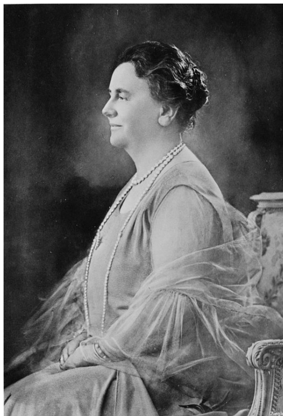
Wilhelmina in 1942.

Door de evenredige vertegenwoordiging die bij de grond- wetswijzing van 1917 werd ingevoerd en de invoering van het vrouwenkiesrecht (passief kiesrecht in 1917, actief kiesrecht in 1922) in ontstond er een electorale stabiele situatie waardoor de protestants-christelijke partijen in een gunstige middenpositie zaten. Tot ergernis van Wil- helmina was het parlement tegelijkertijd versplinterd en ontstond er met enige regelmaat een kabinetcrisis. Na de nodige consultatierondes vormden dezelfde partijen weer een kabinet.