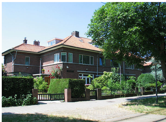
Woonhuis Wilhelmina aan de Nieuwe Parklaan in Den Haag

nationaal kabinet voor herstel en vernieuwing te vormen. Dit leidde tot het kabinet-Schermerhorn-Drees. Volgens Drees was het aanstellen van twee formateurs, een idee van Wilhelmina zelf. [15]