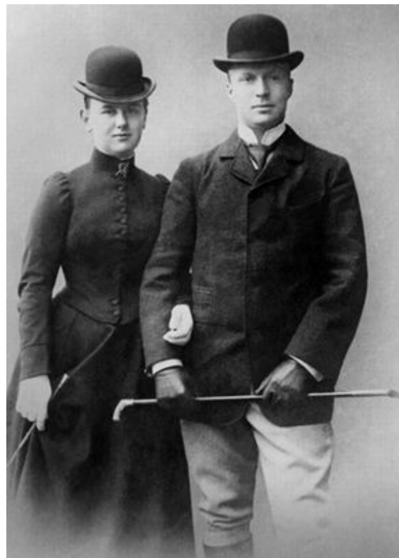
Foto van Wilhelmina en Hendrik van 17 oktober 1900, een dag na de bekendmaking van de verloving.

Er werd gezocht naar een echtgenoot voor de jonge koningin. Britse kandidaten vielen af vanwege de Boerenoorlog. “Aber nur ein Deutscher Prinz darf sie bekommen”, schreef de Duitse keizer in de kantlijnen van een diplomatiek ambtsbericht. [3]