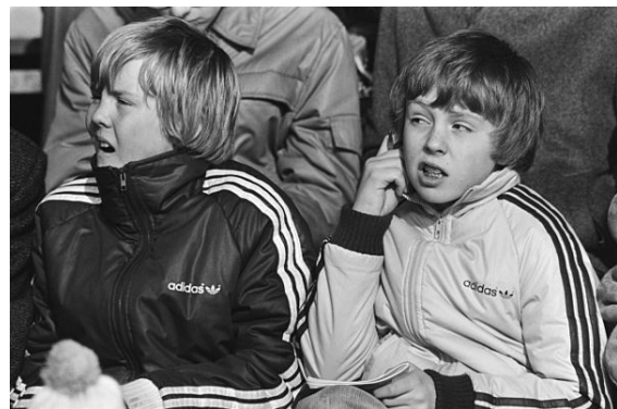
Prins Willem Alexander (links) met zijn jongere broer prins Constantijn tijdens de WK sprint in 1982.

Toen Beatrix in 1980 koningin werd, kreeg haar oudste zoon automatisch de titel Prins van Oranje. Toen de prins de leeftijd van achttien jaar bereikte, werd hem zitting verleend in de Raad van State. [noot 2]