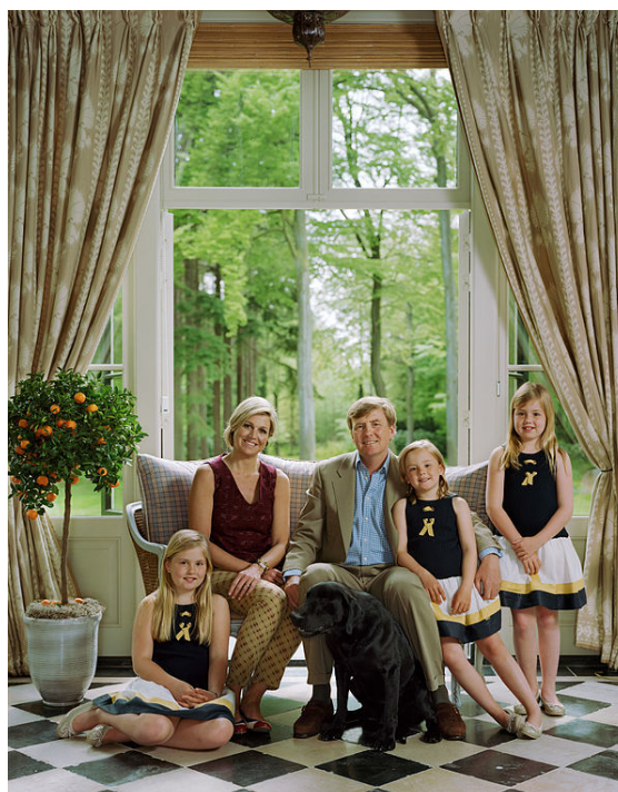
Willem-Alexander en Maxima met hun kinderen in 2013

Het huwelijk van Willem-Alexander met Maxima werd op 2 februari 2002 in de Grote Zaal van de Beurs van Berlage voltrokken door burgemeester Job Cohen van Amsterdam. [noot 5]