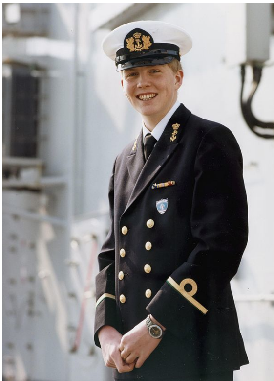
Prins Willem-Alexander als luitenant-ter-zee der derde klasse in 1986

Na het behalen van zijn bul begon zijn voorbereiding op het koningschap. Willem-Alexander volgde meerdere cursussen; onder andere bij de Rijksluchtvaartschool, waar hij zijn vliegbrevet behaalde, en bij de Koninklijke Landmacht. Zijn dienstplicht vervulde hij van augustus 1985 tot januari 1987 bij de Koninklijke Marine, onder meer aan boord van Hr. Ms. Tromp en Hr. Ms. Abraham Crijnsen en in 1988 als wachtofficier aan boord van Hr. Ms. Van Kinsbergen. Tegelijkertijd begon hij zich meer in het openbare leven te profileren. Hij vervulde representatieve taken bij officiële evenementen en legde officiële