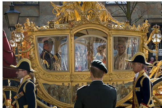
De Gouden Koets met van links naar rechts (in de koets): Willem-Alexander, koningin Beatrix en prinses Máxima.

Willem-Alexander is titularis van de volgende dynastieke, erfelijke of vorstelijke titels: