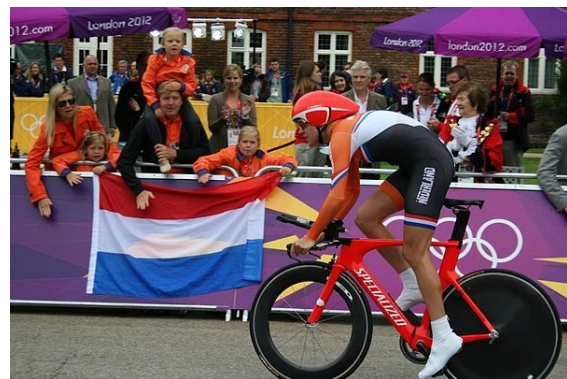
Willem-Alexander met zijn gezin op de Olympische Zomerspelen 2012 bij het aanmoedigen van Ellen van Dijk.

In 1986 reed hij onder de schuilnaam W.A. van Buren de Elfstedentocht uit. [6] Zijn kleding, een Playboy-broek en een Marlboro-jack, veroorzaakte in de media enige opschudding, omdat hij met de opzichtige logo's in feite reclame maakte. In 1992 liep hij met onder meer Gerrie Knetemann de marathon van New York uit.