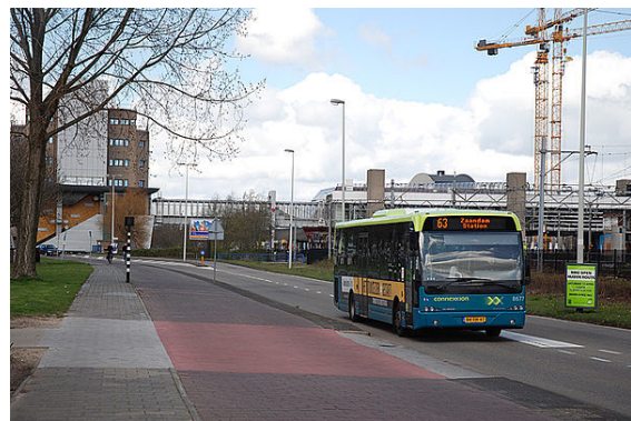
Bus bij station Zaandam.

De gemeente bevindt zich pal langs de A7, de A8, de N246 en de N203 en heeft directe spoor- en wegverbindingen met Amsterdam. Binnen de gemeente bevinden zich zes spoorwegstations: Station Zaandam, Station Koog Bloemwijk, Station Koog-Zaandijk, Station Wormerveer en Station Krommenie-Assendelft langs de lijn Amsterdam - Alkmaar en (opnieuw) Station Zaandam en Station Zaandam Kogerveld langs de lijn Amsterdam - Enkhuizen. Vanaf station Zaandam rijden frequent sprinters in de richtingen Uitgeest, Schiphol, Amsterdam en Hoorn Kersenboogerd. Intercityverbindingen zijn er met Den Helder, Alkmaar, Amsterdam, Utrecht, Den Bosch/Arnhem, Eindhoven en Maastricht. Voorheen had station Zaandam ook verbinding met Enkhuizen, maar sinds dat deze trein een Intercity is geworden zijn Station Zaandam en Zaandam Kogerveld deze kwijt geraakt. Dit is trouwens de enige Intercity die niet in Zaandam stopt. Het busvervoer in Zaanstad is in handen van Connexxion.