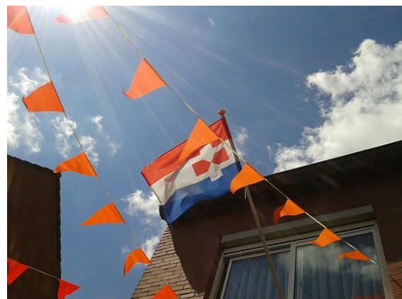
Tijdens 200 jaar stadsrechten

De originele vlag van de gemeente Zaanstad bestaat uit de kleuren rood, wit en blauw. Deze vlag is alleen te verkrijgen in de afmeting van 1,50 bij 2,25 meter.