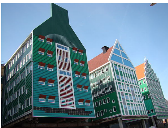
Het uit 2011 daterende gemeentehuis van Zaanstad te Zaandam waarvan de architectuur is geïnspireerd op traditionele Zaanse huisjes.

Zaanstad (uitspraak (info / uitleg)) is een gemeente in de Nederlandse provincie Noord-Holland. De gemeente is de grootste in de Zaanstreek. Per 3 april 2013 had de gemeente Zaanstad 150.000 inwoners. [1]