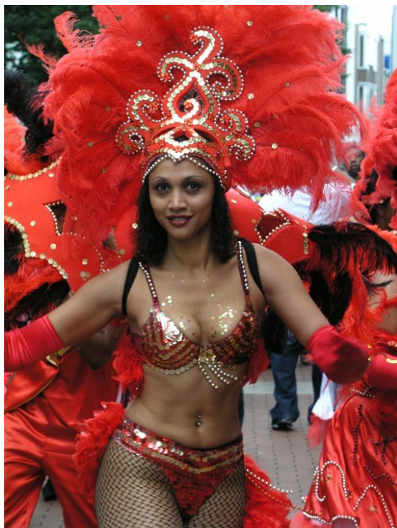
Sweet Lake Caribbean Festival