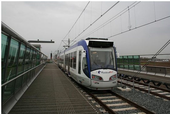
RandstadRail-tram op station Javalaan

boven een oude pijpleiding die vroeger voor brandstof werd gebruikt, maar nu voor hogedruk-CO 2 -opslag en -transport wordt ingezet. De bouw van het nieuwe station is nog niet begonnen.