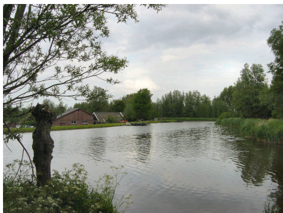
Noord Aa, ter hoogte van Boerderij 't Geertje