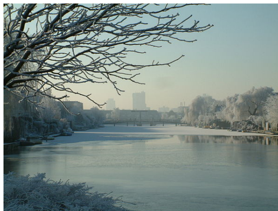
Broekwegwetering De Leijens

Zoetermeer is een groene gemeente en ligt midden in het Groene Hart. Hierdoor is Zoetermeer omringd door prachtige polderlandschappen en aan de oostzijde het Rottegebied. Door het relatief hoge percentage eengezinswoningen is er veel privégroen en daarnaast zijn de woonwijken ruim van opzet, met veel ruimte voor openbaar groen. In elke wijk zijn één of meer wijkparken te vinden. Tot slot zijn er de grote stadsparken, met veel natuur, sport- en recreatievoorzieningen.