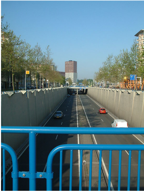
De tunnelbak gezien in westelijke richting