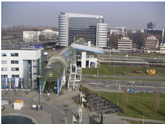
Station Zoetermeer en de Nelson Mandelabrug