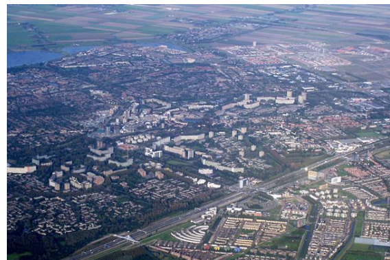
Zoetermeer gezien vanuit de lucht

Soetermeerse meer. Het veen werd afgestoken en zelfs onder water uitgebaggerd en als turf in omliggende steden als brandstof verkocht. Als gevolg van de veenontginning ontstonden grote waterpartijen. Vanaf de 17e eeuw zijn eerst het Soetermeerse meer (1616) en vervolgens de overige waterpartijen ingepolderd en verkaveld. De polder waar de huidige wijken Buytenwegh en De Leyens zich bevinden, werd in 1770 opnieuw drooggelegd.