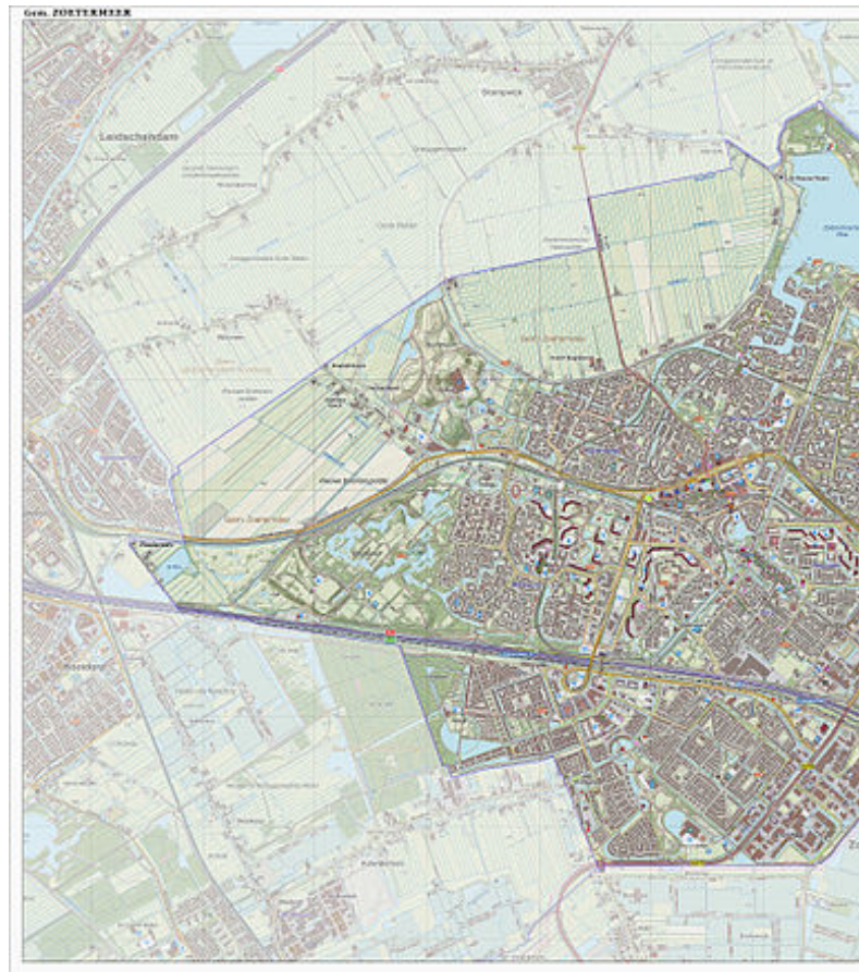
Topografisch kaartbeeld van de gemeente Zoetermeer, per juni 2015. Klik op de kaart voor een vergroting.