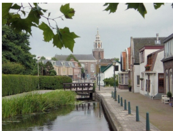
Het oude dorp Zoetermeer met Oude kerk

Zoetermeer kent vele geloofsgemeenschappen, waaronder: