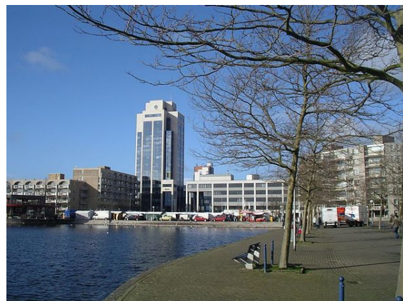
Dobbeplass, Markt en Stadshart