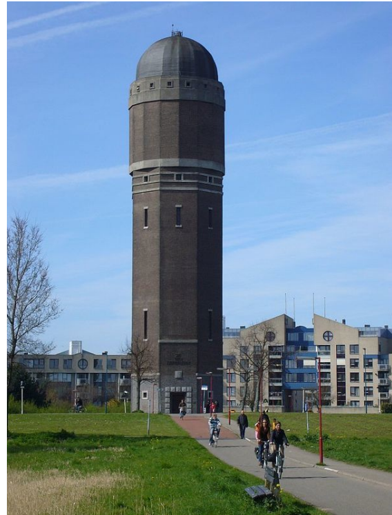
2 Watertoren De Tien Gemeenten

De aansluiting van Zoetermeer op het spoorwegnet in 1868 kondigde het begin aan van de groei van Zoetermeer en Zegwaard. De Molenweg werd tot Stationsstraat omgedoopt toen het station 'Zoetermeer-Zegwaard' in gebruik werd genomen. In de omgeving van het dorp werd door veel boeren boter geproduceerd, waardoor Zoe-