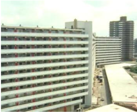
De uitbreiding van Zoetermeer (1973)