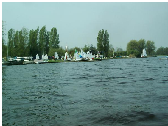
Zoetermeerse plas, Noord Aa